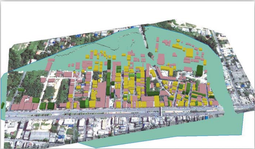
แผนผังชุมชนวัดหาดใหญ่ใน (น้ำในคลองต่ำระดับสูงกว่าขอบตลิ่ง 0.50 ม.) หรือ ระดับ 6.50 ม.(ร.ท.ก.)