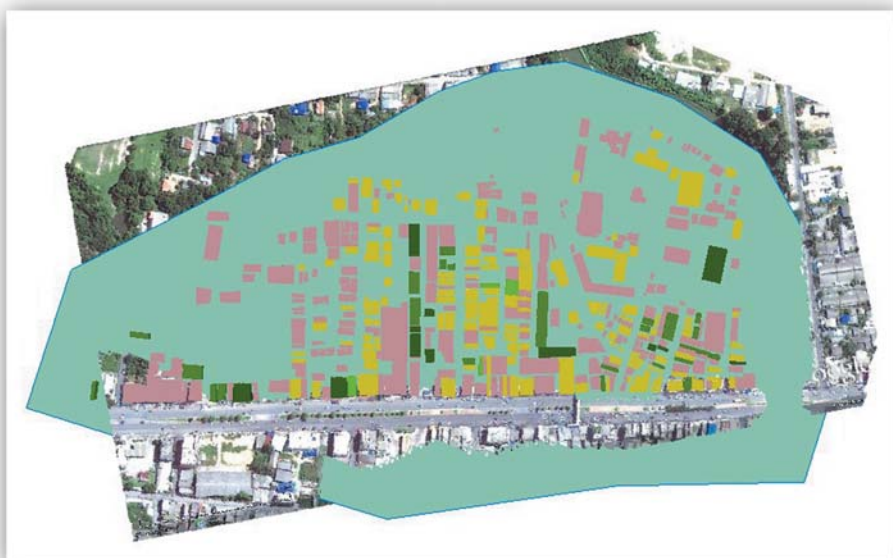
แผนผังชุมชนวัดหาดใหญ่ใน (ระดับน้ำท่วม 7.50 ม.(ร.ท.ก.) ระดับน้ำจะท่วมเสมอถนนเพชรเกษม