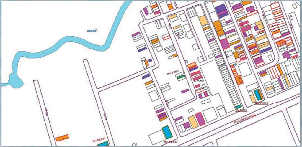
ผังแสดงบ้านที่เสี่ยงประจำชอย