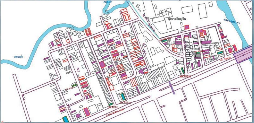
■ ภาพแสดงพื้นที่บ้านผู้สูงอายุ