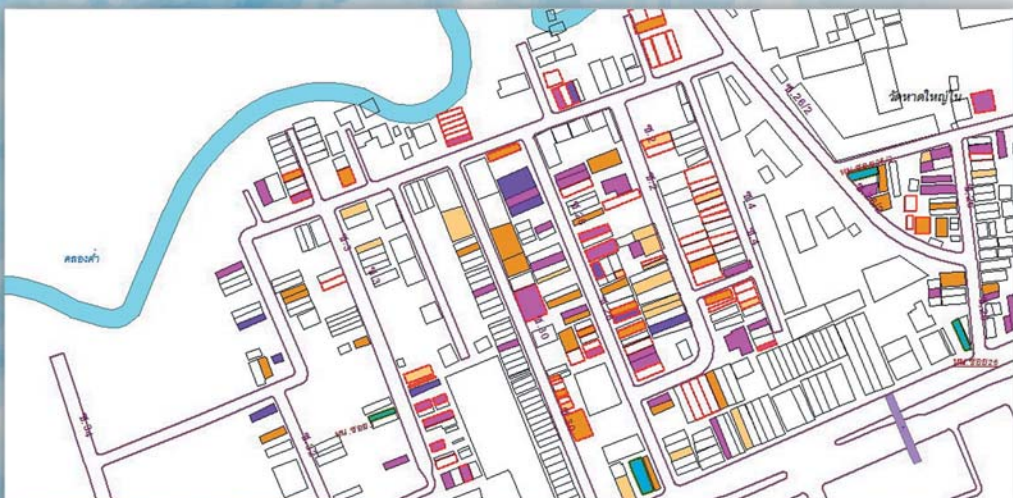
ผังแสดงบ้านที่เสี่ยงประจำซอย