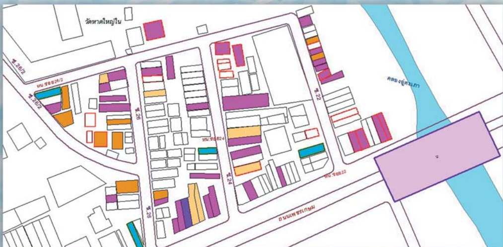
ผังแสดงบ้านที่เสี่ยงประจำซอย