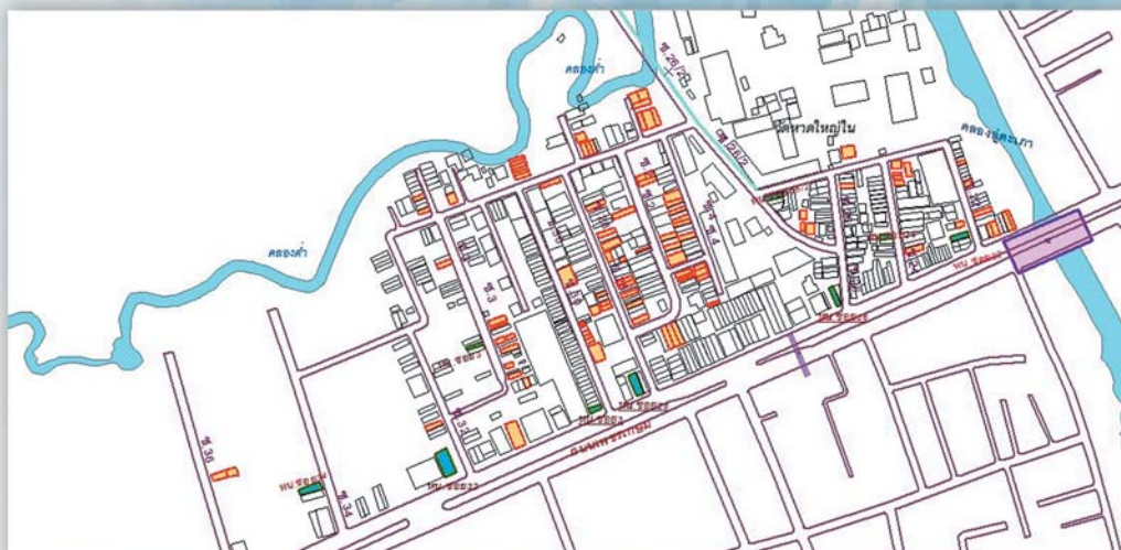
ภาพแสดงพื้นที่อาคารชั้นเดียว