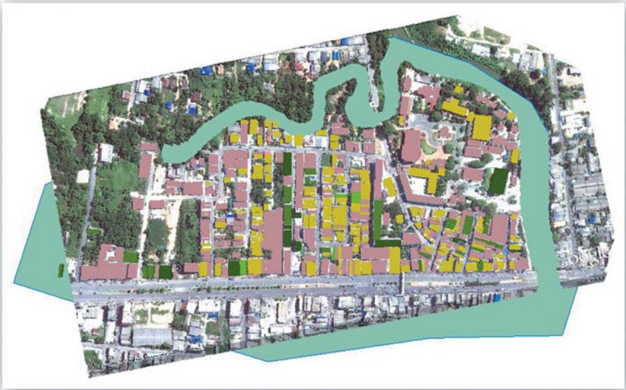
แผนผังชุมชนวัดหาดใหญ่ใน (น้ำในคลองต่ำระดับเสมอตลิ่ง)