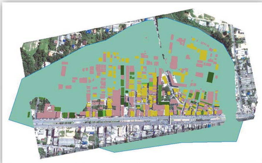
แผนผังชุมชนวัดหาดใหญ่ใน (น้ำในคลองต่ำระดับสูงกว่าขอบตลิ่ง 1.00 ม.) หรือ ระดับ 7.00 ม. (ร.ท.ก.)