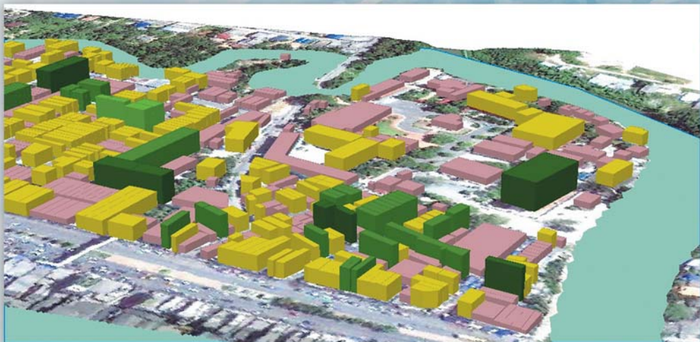
ชุมชนวัดหาดใหญ่ในเมื่อมองจากสะพานคลองคูตะเกา