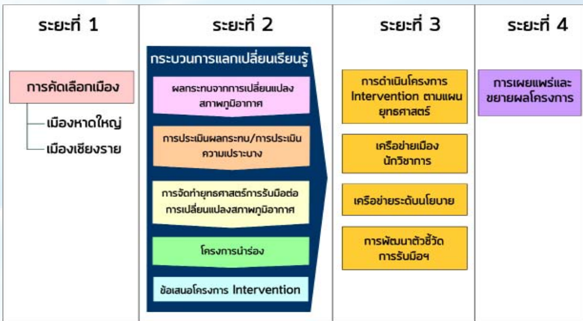
ภาพแสดงลำดับการดำเนินโครงการ ACCCRN

ได้รับการสนับสนุนโดยมูลนิธิร็อกกี้เฟลเลอร์ (The Rockefeller Foundation) ดำเนินการใน 4 ประเทศ ในภูมิภาคเอเชีย ได้แก่ อินเดีย เวียดนาม อินโดนีเซีย และไทย โดยมีวัตถุประสงค์เพื่อส่งเสริมให้เมือง มีการเตรียมพร้อมรับมือต่อการเปลี่ยนแปลงสภาพภูมิอากาศ โดยประสานงานกันเป็นเครือข่ายที่เน้นการสร้างศักยภาพ ความตระหนัก และความร่วมมือระหว่างภาคีต่างๆ ในระดับเมืองและระดับประเทศ สำหรับประเทศไทยแบ่งการดำเนินงานเป็น 4 ระยะ (พ.ศ. 2552 – 2559)